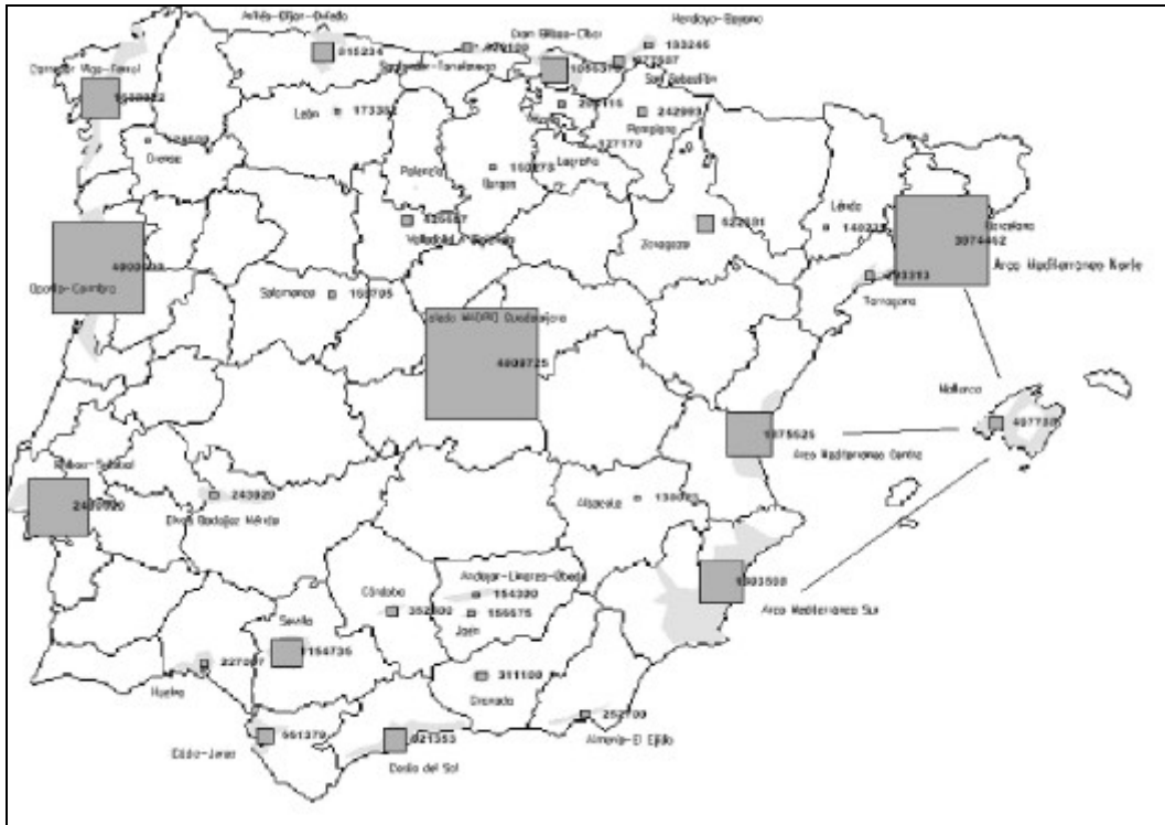
Ciudades medias, mesópolis, grandes ciudades y metrópolis en la Península Ibérica (Elaboración propia sobre datos censales)

A nivel meramente de hipótesis, que como queda dicho habría de ser verificada para cada caso en la misma medida en que intentamos hacerlo para el de Badajoz, podemos establecer la siguiente clasificación de tipologías sobre la casuística recogida en el mapa, componiendo la estructura de redes urbanas que articulan la península ibérica: